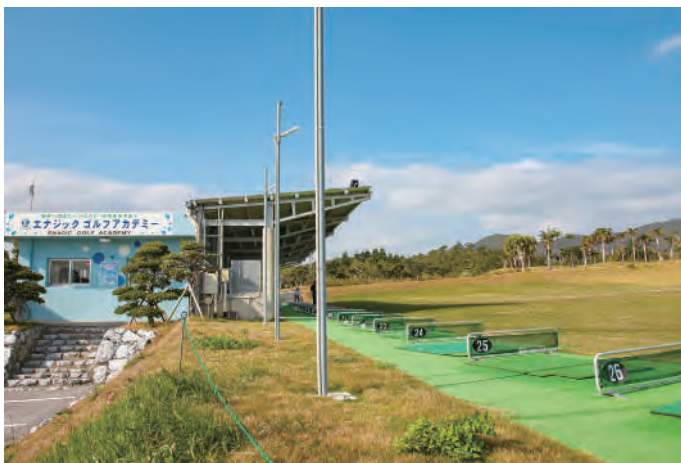
素晴らしい練習環境を備えたエナジックゴルフアカデミー

10月7～9日、沖縄県名護市のゴルフ場で、日本女子プロゴルフ協会(JLPGA)主催のステップ・アップ・ツアー「2021かねひで美やらびオープン」がおこなわれました。