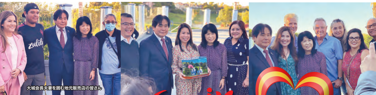
大城会長夫妻を囲む地元販売店の皆さん