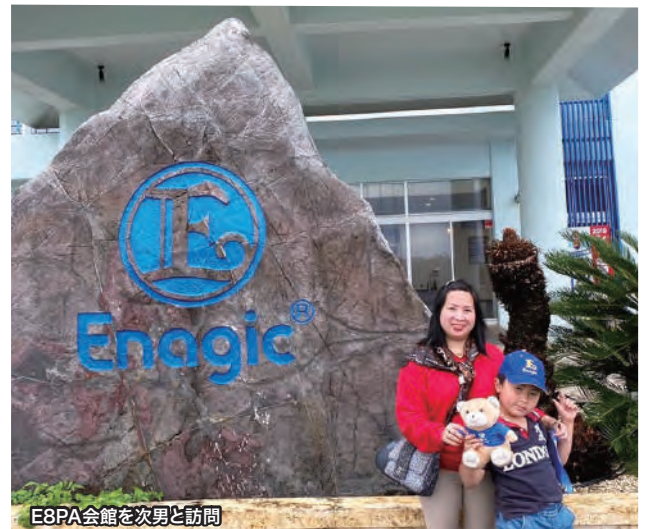
E8PA会館を次男と訪問