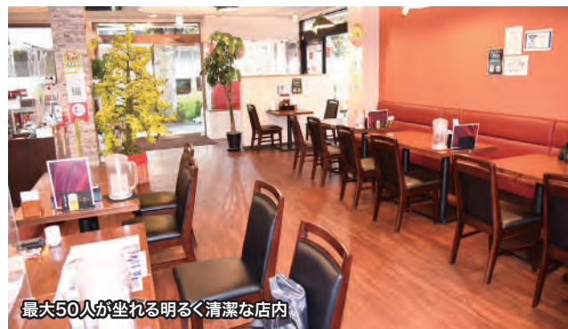
最大50人が坐れる明るく清潔な店内

「コロナ禍」を何とか乗り切り、第2号店の出店計画もあるというランさんは、「還元水が健康に良いということが何よりも魅力です」と話している。