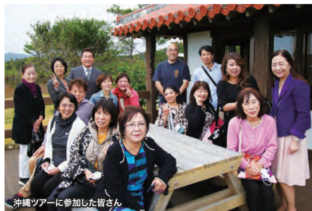
沖縄ツアーに参加した皆さん

9日は沖縄還元フーズのウコン工場を見た後、エナジック瀬嵩カントリークラブとその敷地内の「6A2-3記念樹コーナー」を見学。E8PA会館で夕