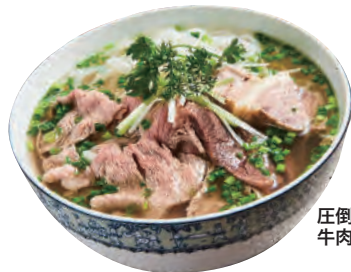
圧倒的人気の 牛肉フォー