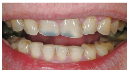
酸蝕症の症状(前歯の青い部分)

わたしは片手にスポーツドリンク、片手に還元水を持って、うまく摂取していくのがいいのではないかと思います。