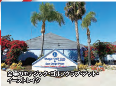
会場のエナジック・ゴルフクラブ・アット・イーストレイク

10月29日午後、カリフォルニア州チュラ・ビスタ市にある「エナジック・ゴルフクラブ・アット・イーストレイク」の特設会場で、アメリカ初の試みとなるスペイン語をメインにする大城博成会長講演会が開催されました。