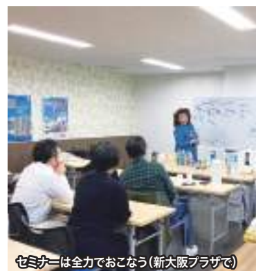
セミナーは全力でおこなう(新大阪プラザで)