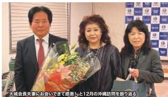
「大城会長夫妻にお会いできて感激!」と12月の沖縄訪問を振り返る