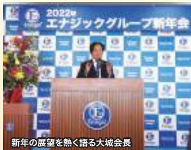
新年の展望を熱く語る大城会長

1月4日午後、沖縄県名護市瀬高のE8PA会館2階大ホールで、エナジックインターナショナルを始め、グループ各社各団体の代表者や幹部と海外拠点の責任者らが勢ぞろいし、コロナ対策を取りながら2022年の門出を祝いました。