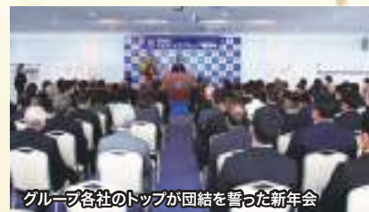
グループ各社のトップが団結を誓った新年会

大城会長もあいさつの中で同様の主旨のことを語り、グループ各社各団体がそれぞれの役割を絡ませながら、エナジックの企業理念を共有し「真の健康」の実現をめざそうと強調しました。