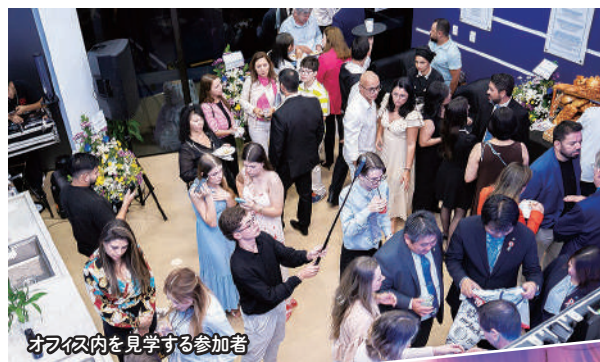
オフィス内を見学する参加者