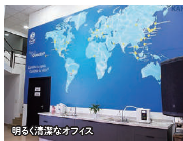
明るく清潔なオフィス

Calle Gabriel Casaccia c/ Emilio Bobadilla Paraná Country Club, Hernandarias - Alto Paraná C.P. 100519 - Paraguay Tel: Tel./WhatsApp: +595 975 408411 E-mail: ventas@enagic.com.py Web: www.enagic.com.py