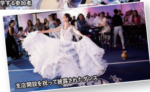
支店開設を祝って披露されたダンス