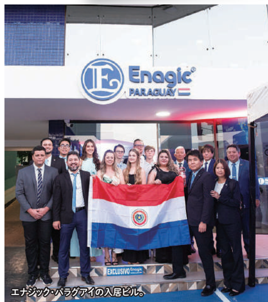
エナジック・パラグアイの入居ビル。