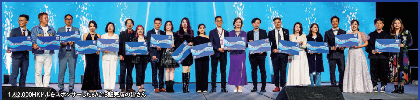
1人2,000HKドルをスポンサーした6A2-3販売店の皆さん