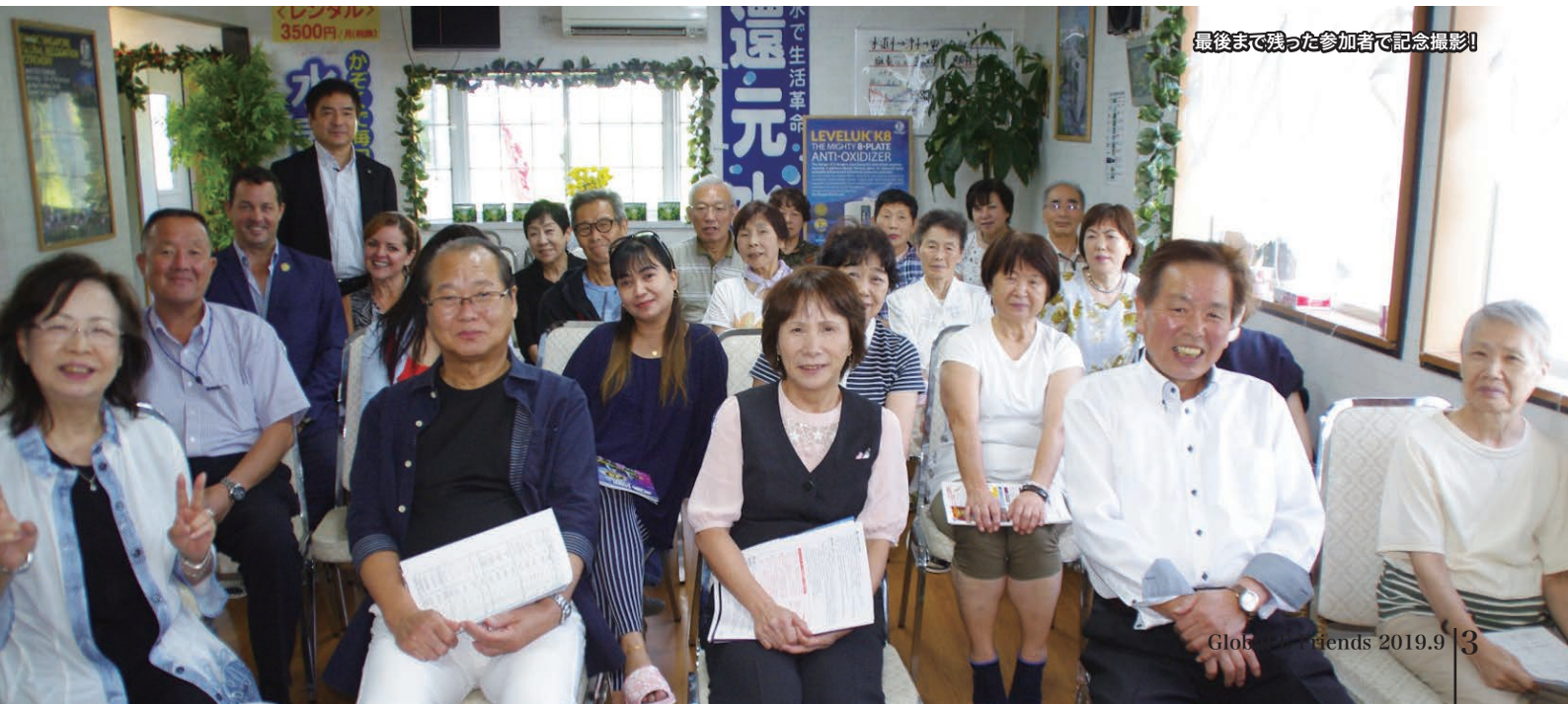
最後まで残った参加者で記念撮影!