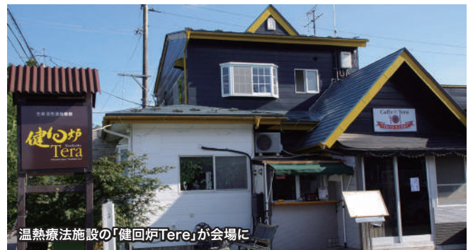
温熱療法施設の「健回炉Tera」が会場に