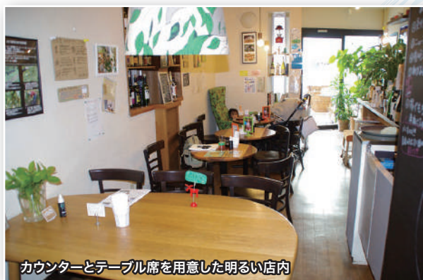
カウンターとテーブル席を用意した明るい店内

If you know of any unique use for electrolyzed water, we'd love to hear from you! 電解水のユニークな活用法を募集中!