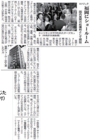
ショールームの開設イベントを報じた『日本流通産業新聞』(8月22日付)

記事の末尾ではショールームへのアクセス方法や凝ったインテリアの様子なども紹介。住所・電話・Fax番号も掲載しています。