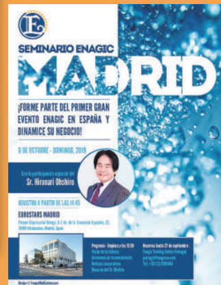
マドリード・セミナー