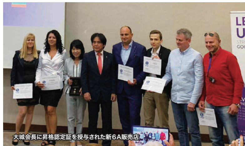
大城会長に昇格認定証を授与された新6A販売店