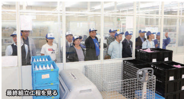
最終組立工程を見る