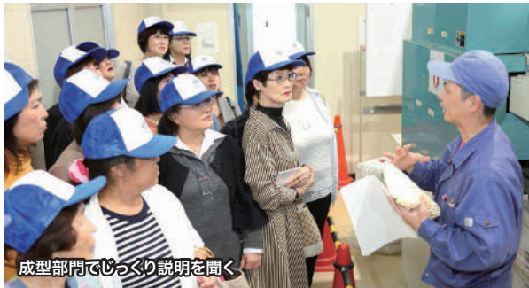
成型部門でじっくり説明を聞く