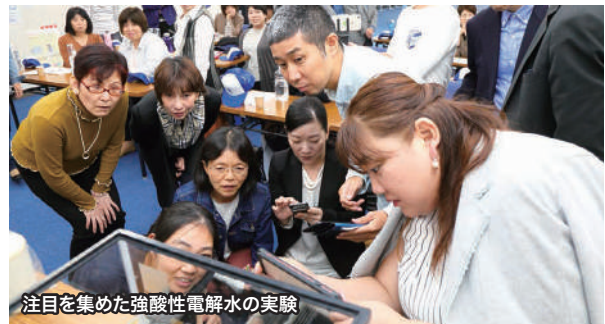
注目を集めた強酸性電解水の実験