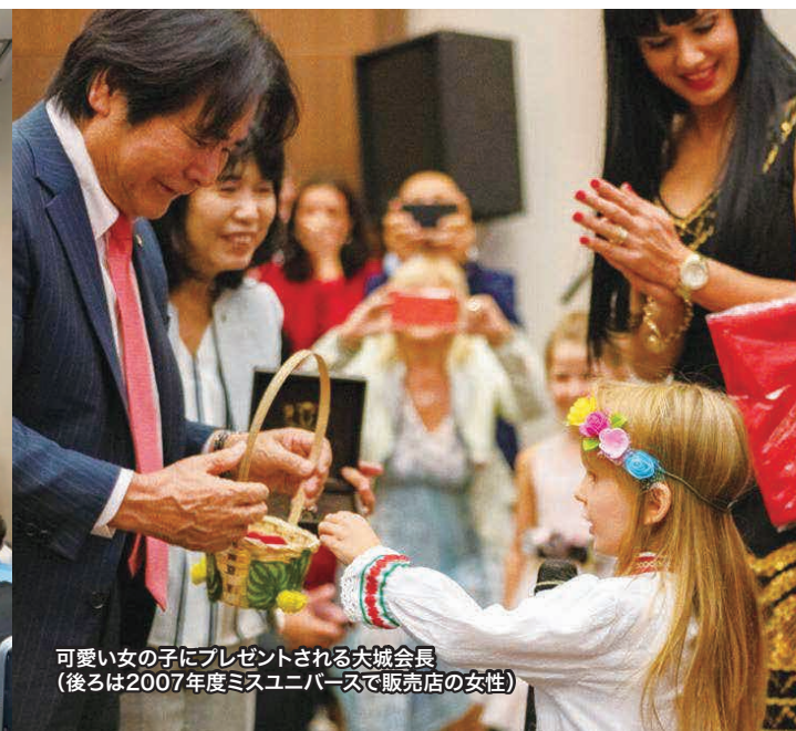
可愛い女の子にプレゼントされる大城会長 (後ろは2007年度ミスユニバースで販売店の女性)