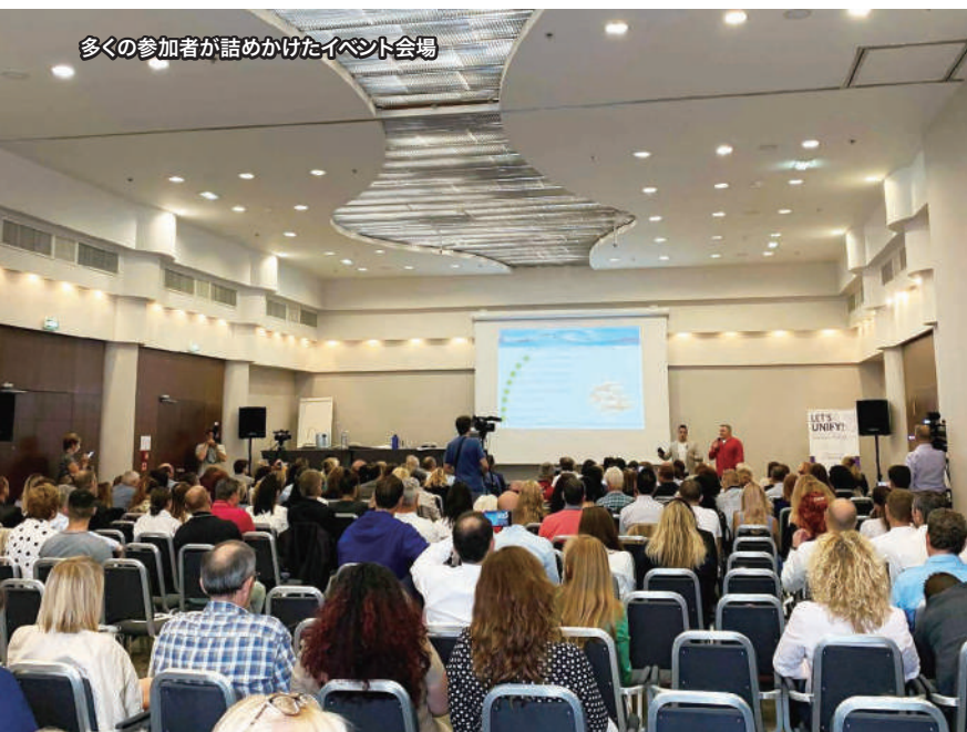
多くの参加者が詰めかけたイベント会場