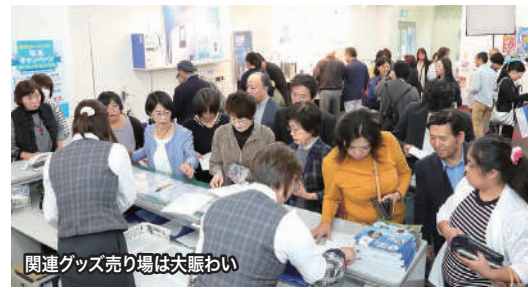
関連グッズ売り場は大賑わい