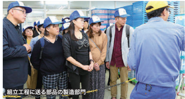
組立工程に送る部品の製造部門