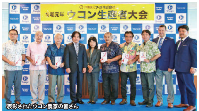
表彰されたウコン農家の皆さん