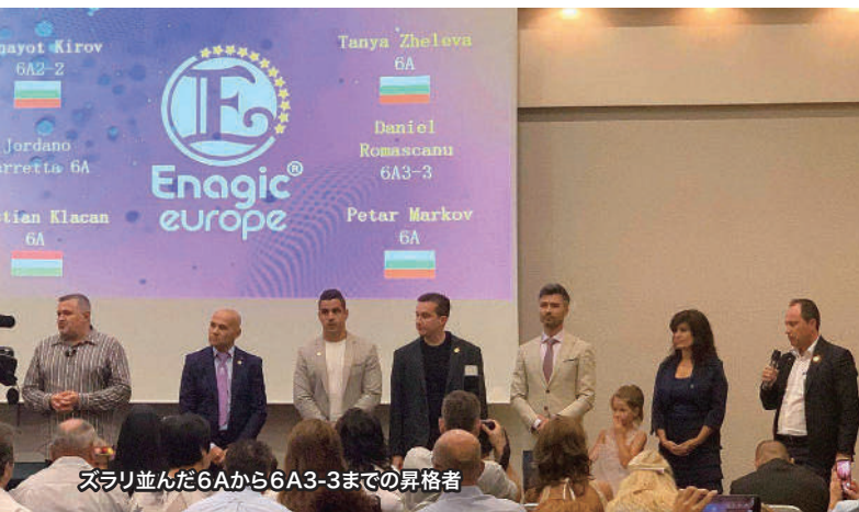
ズラリ並んだ6Aから6A3-3までの昇格者

昇格認定式では新6Aおよびそれ以上のポジションに達した販売店が次々に壇上に上がって認定証を授与され、ファミリーや仲間たちから熱い祝福を受けていました。東欧のエナジックビジネスはいま、新たな高い段階に達したようです。