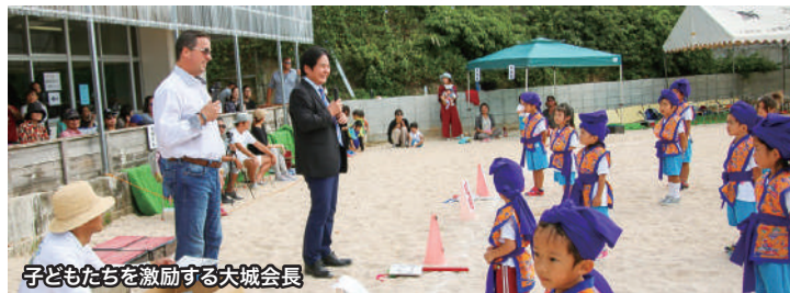
子どもたちを激励する大城会長