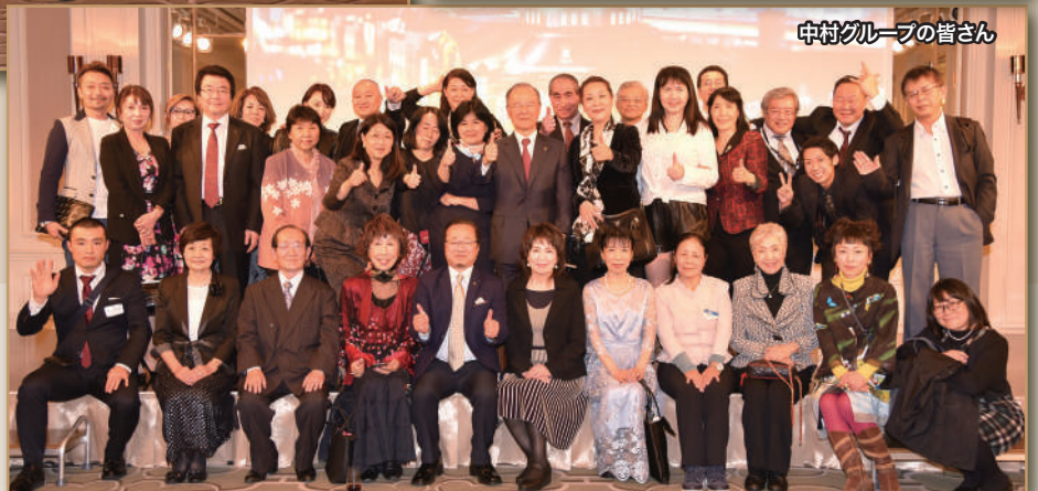
中村グループの皆さん