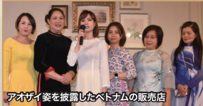
アオザイ姿を披露したベトナムの販売店