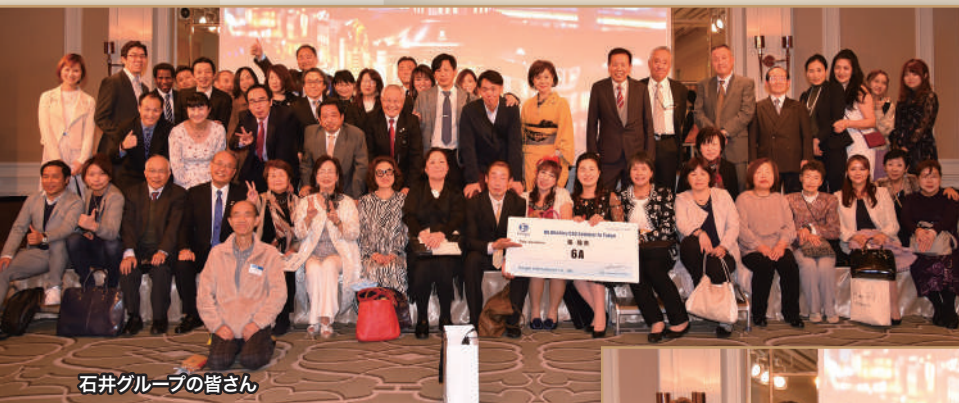
石井グループの皆さん