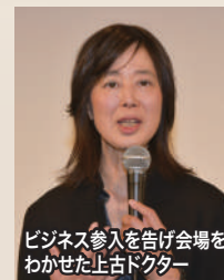
ビジネス参入を告げ会場をわかせた上古ドクター