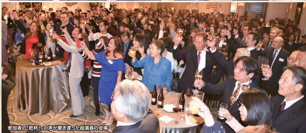
参加者の「乾杯!」の声が響き渡った超満員の会場