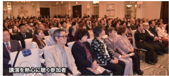
講演を熱心に聴く参加者

次いで大城会長は、いまや130万人が乗船しているエナジック丸に、「あなたも一緒に乗って船出しませんか」と