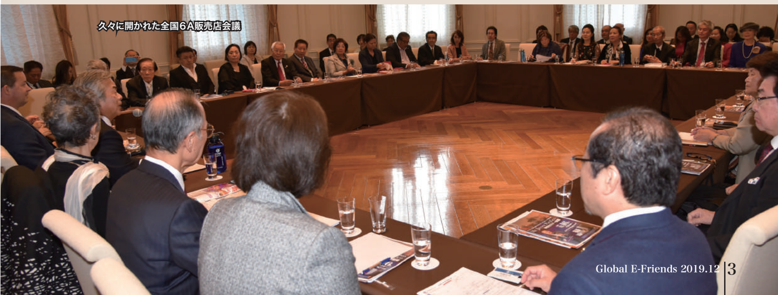
久々に開かれた全国6A販売店会議

次いで、担当社員よりいくつか連絡事項が伝えられました(別表を参照)。その後、スケジュールの確認をおこなってからいったん散会し、次の会長講演会に臨みました。