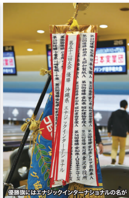
優勝旗にはエナジックインターナショナルの名が