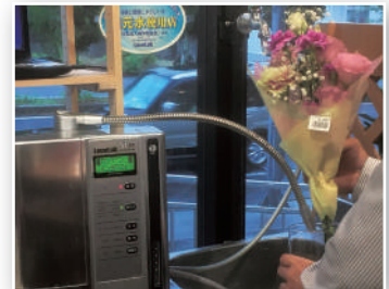
還元水に浸けた切り花の新鮮さは大幅に延長理に使い効果をあげている。

延長以外にも、いろいろな効果がある。栄養剤では避けられなかった切り花を浸けた水の濁りが、還元水ではごく少なくなった。それだけでなく、たとえば百合の花の場合、蕾から開花する段階で色合いが良くなり、花も鮮やかに咲くようになったという。安全性の面でも、還元水のほうが優れているだろう。還元水以外の電解水は清掃・衛生管