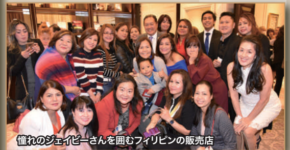
憧れのジェイビーさんを囲むフィリピンの販売店