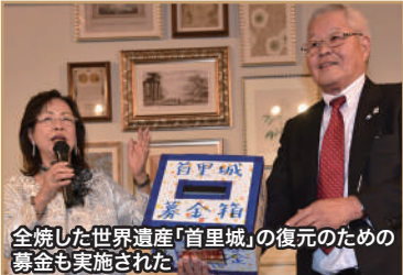
全焼した世界遺産「首里城」の復元のための 募金も実施された