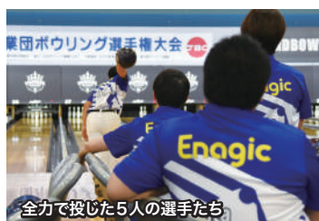
全力で投げた5人の選手たち

11月22日から24日まで、(財)全日本ボウリング協会(JBC)が主催し、東京都東大和市の東大和グランドボウルでおこなわれた「第52回全日本実業団ボウリング選手権大会」で、エナジックインターナショナル・チームがみごと優勝しました！ 2015年の第48回大会で優勝し、昨年は2位に食い込んだエナジックですが、またも栄冠を手にすることができたのです。