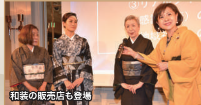
和装の販売店も登場