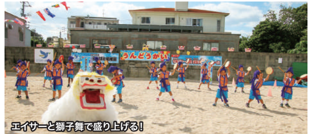
エイサーと獅子舞で盛り上げる!

午後には、同じくエナジックグループの特別養護老人ホーム「社会福祉法人水寿会／瑞穂の郷」(名護市字親川)が開催した“長老祭”にも大城会長が参加し、入居中の“おじい・おばあ”の長寿を寿ぐ温かいメッセージを述べました。