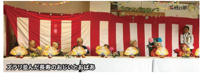
ズラリ並んだ長寿のおじいとおばあ

社会福祉法人水寿会は、糸満市でも特養ホーム、デイサービス、介護支援等を展開しています。エナジックグループは社会貢献活動の一環として、老若男女の心身の健康に寄与するため、今後もますます福祉・教育に力を入れていく方針です。