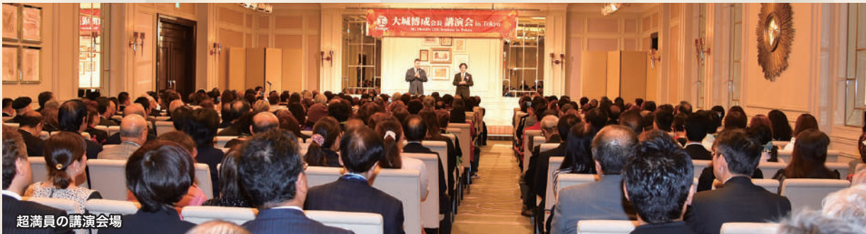
超満員の講演会場

語りかけました。さらに、現代は「物語の時代」として、還元水を飲んで仲間を増やし、困っている人を助けることで、自分自身の豊かなストーリーを描き出しましょうと呼びかけました。最後に、「自分の人生は自分で変えるのです。Change your Water, Change your Lifeですよ!」と強調して話を終えました。場内からは一斉に熱い拍手が巻き起こりました。