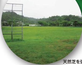
天然芝を張ったグラウンド