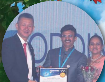
グローバルレポート: 3P 2/2 インド支店4周年記念イベント