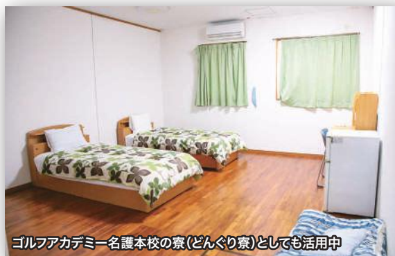
ゴルフアカデミー名護本校の寮(どんぐり寮)としても活用中

加えて、元校舎には各種の器具を用意した本格的なトレーニングルームや、ミーティングや学習の場として活用