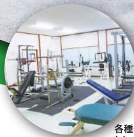
各種器具を備えた トレーニングルーム