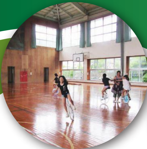
旧講堂で一輪車に乗って遊ぶ子どもたち