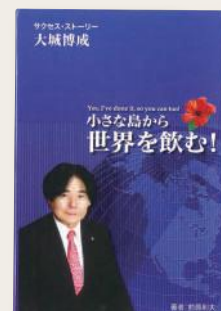
【前原利夫・著】 『小さな島から世界を飲む!』より】

大城の成功の鍵を探すと、彼は母の教えから大きな刺激を受けていることが分かる。沖縄から世界へと舞台を広げながらも、その原点は沖縄であり、母の教えなのである。