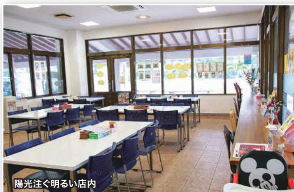
陽光注ぐ明るい店内

人気メニューは、豆腐チャンプルー定食や野菜チャンプルー定食、さらにソーキそばなど。弁当作りも請け負っている。ランチタイムは10時から15時まで。豊富なメニューは、きっとあなたを満足させるに違いない。