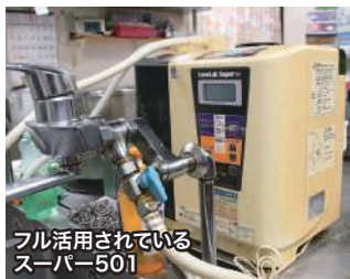
フル活用されている スーパー501

エナジックグループの還元レストラン「南乃畑・大浦店」は、このわんさかパーク内にある地産地消を基本にする食堂。エナジックグループには現在、この大浦店と、「南乃畑 エナジック天然温泉アロマ店」(宜野湾市)、および「南乃畑 エナジック具志川ゴルフクラブ店」(うるま市)の3カ所の「南乃畑」がある。