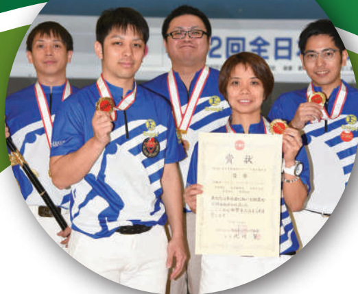
全日本優勝メンバーがスタッフ