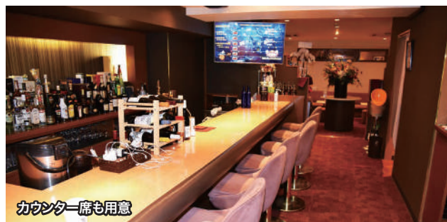
カクテル一席も用意

If you know of any unique use for electrolyzed water, we'd love to hear from you! 電解水のユニークな活用法を募集中!