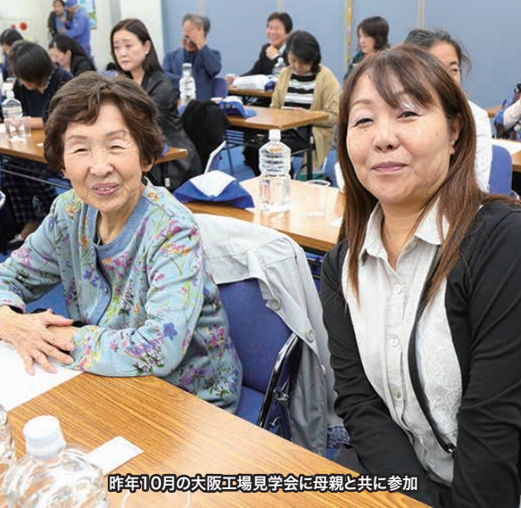
昨年10月の大阪工場見学会に母親と共に参加