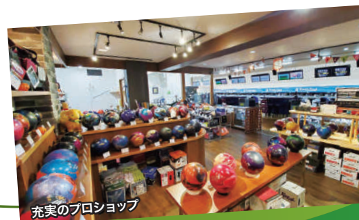
充実のプロショップ

もう1台は床掃除などの清掃用に使われています。一例をあげると、レーンにひかれたオイルのふき取りに使うクリーナーの効果を高めるため、強還元水を混ぜているのです。ちなみに毎日おこなわれるこのふき取り(行き)と、オイルひき(帰り)の「往復運動」は、FLEXという最新鋭のオイルマシンが自動的におこなっています。美浜ボウルはすべての面で最高水準の施設と言えるでしょう。