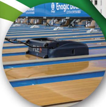
最新鋭の オイルマシンFLEX