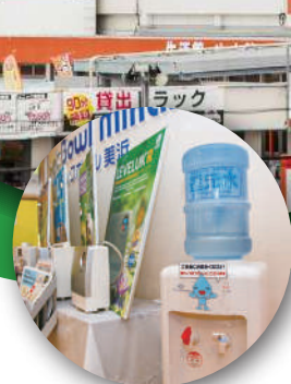
還元水は誰でも自由に飲用できる