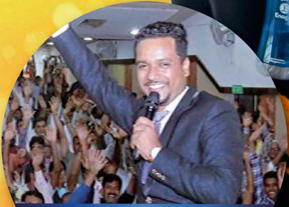
Distributor Profile : 8P ナゲージュワール・シュクラ (インド)