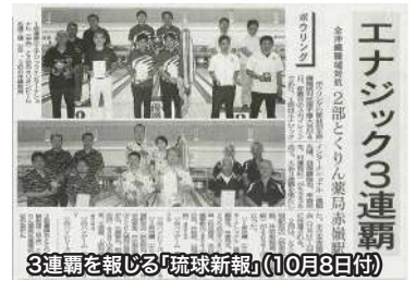
3連覇を報じる「琉球新報」(10月8日付)

ちなみにこの大会は、全日本実業団産業別選手権(産別)、全日本実業団都市対抗大会(都市対抗)を合わせた“3大実業団選手権”の中でも最も権威があるとされています。昨年の第52回同大会(東京都)では、優勝に輝いただけあって、メンバー全員が「連覇達成!」を目標に意気込んでいます。大いに期待しましょう!