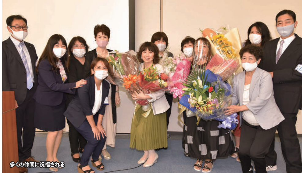
多くの仲間に祝福される