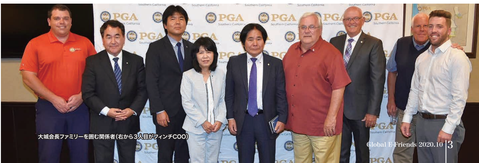
大城会長ファミリーを囲む関係者(右から3人目がフィンチCOO)

そしていま、エナジック所有のゴルフ場の責任者として存分に腕をふるっているのです。コロナ禍のあおりで中断していたエナジック・サンディエゴ・カウンティオープンも、10月13日から15日の期間、開催されることになりました。フィンチCOOの努力がいよいよ実を結ぶ時節となりました。