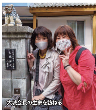
大城会長の生家を訪ねる