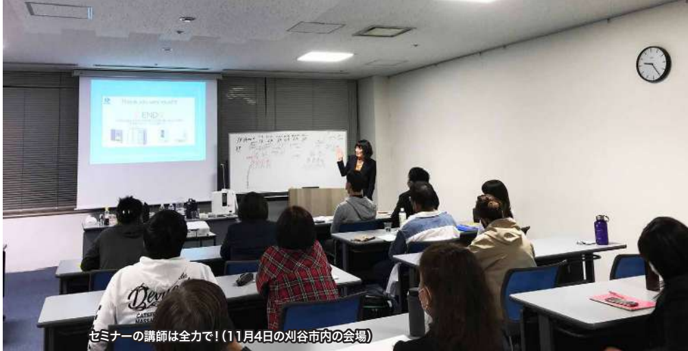
セミナーの講師は全力で！(11月4日の刈谷市内の会場)