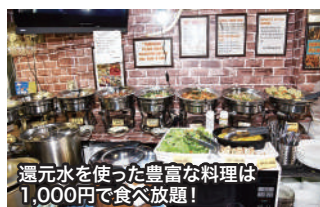
還元水を使った豊富な料理は1,000円で食べ放題!

日本へはエンターテイナーとして1985年来日。92年に日本人と結婚し子どもを2人もうけた。も