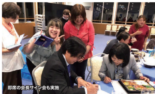
即席の会長サイン会も実施

各地の関連企業・団体を巡った各参加者は、エナジックが多分野にわたり社会貢献をしていることを認識するとともに、至るところで大城会長の「情けの報せ」に触れて感動し、さらに意欲が高まったようです。以下ではいくつかの訪問先を写真で紹介してみます。