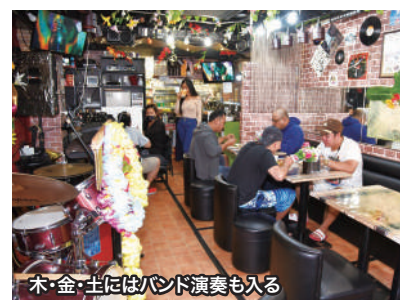
木・金・土にはバンド演奏も入る

人が、夜間は「放題」にひかれて日本人が、それぞれ客の多くを占めるという。その料理にフル活用しているのが還元水だ。野菜の洗浄からスープ、ダシ、炊飯、もちろんアルコールを割る水などに使い、客がいつでも飲用できるように還元水入りサーバーも店内に設置している。