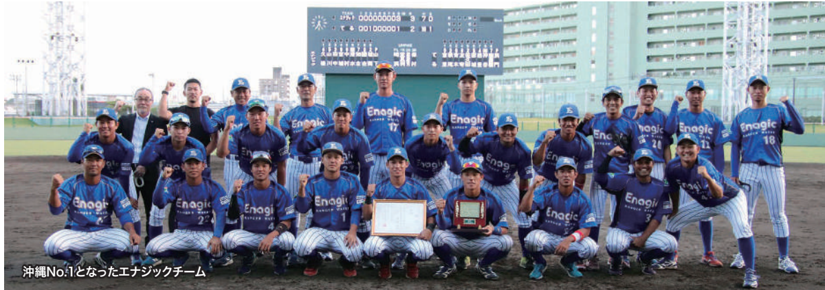
沖縄No.1となったエナジックチーム

沖縄の6つの社会人&クラブチームが参加し10月24、25日におこなわれた「第28回RBC杯争奪硬式野球大会」で、エナジック硬式野球部がみごと優勝しました。“ライバル”沖縄電力とは準決勝で当たりましたが、延長戦タイブレークの10回裏、4対3で劇的なサヨナラ勝ちをおさめたのです。対てるクリニックの決勝戦も9回に追いつき追い越し3対2で優勝を決めました。