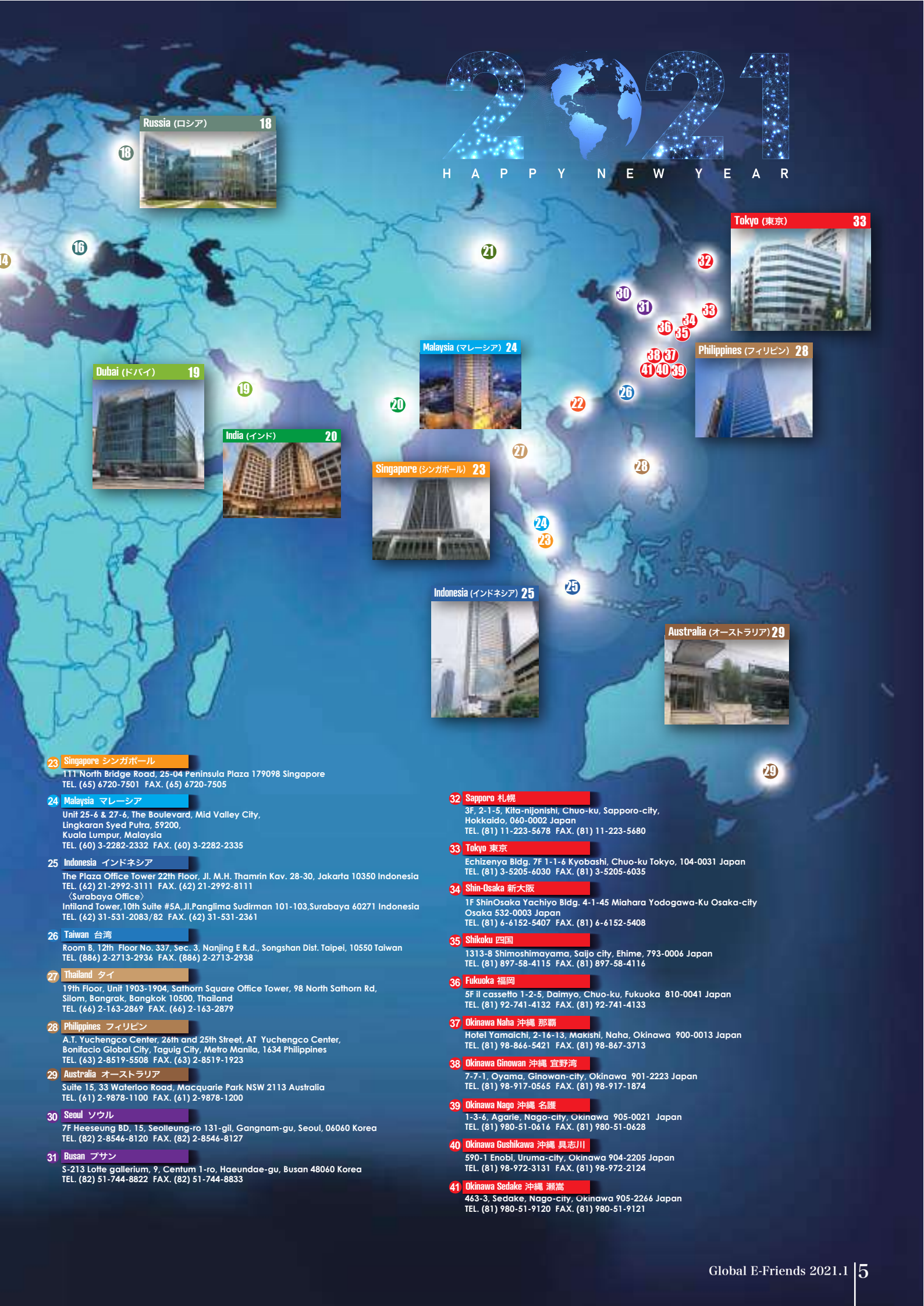
Russia (ロシア) 18