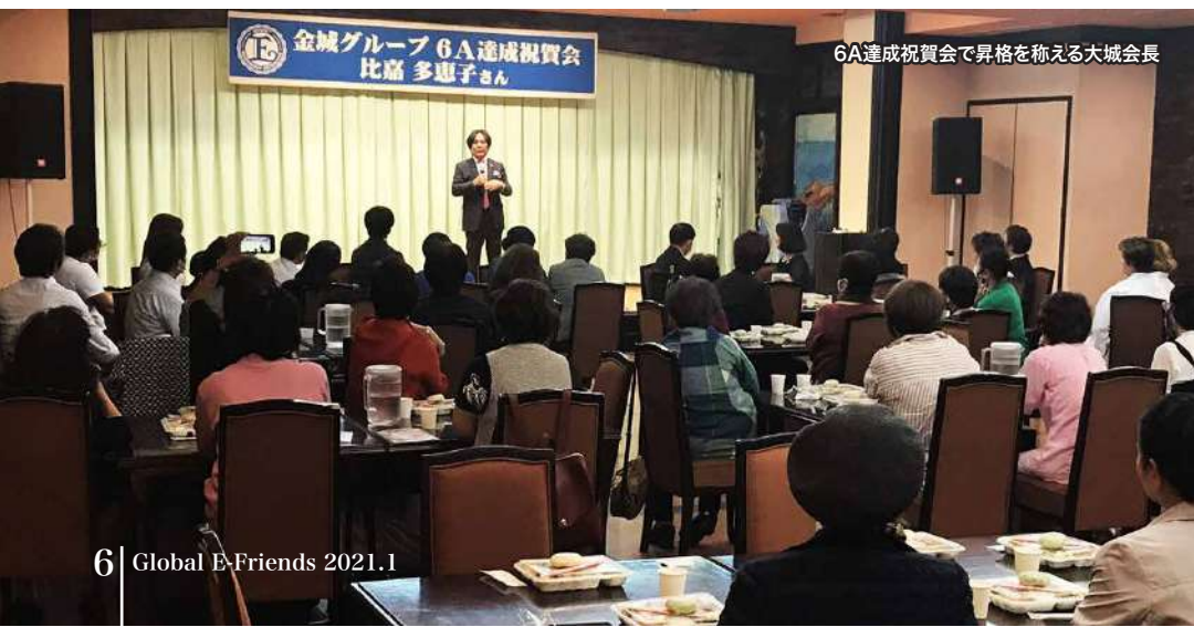
6A達成祝賀会で昇格を称える大城会長