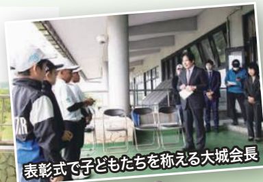
表彰式で子どもたちを称える大城会長