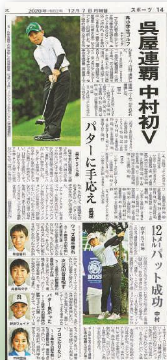
大会の様様を大きく伝える『沖縄タイムス』12月7日号