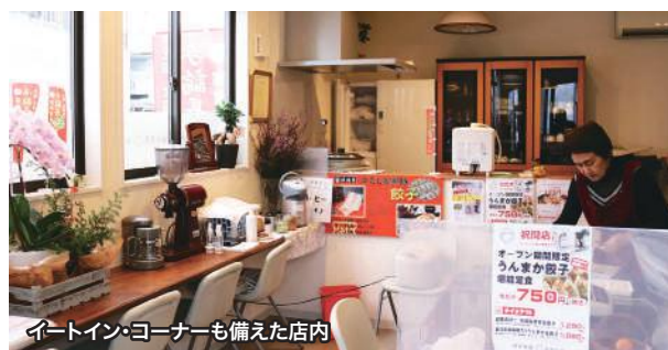
イートイン・コーナーも備えた店内

二世帯住宅で暮らす 娘夫婦ともども還元水を使った調理、強還元水に よる洗剤ナシの洗濯、さらに酸性電解水を使用し た清掃・衛生管理など、レバラックは幅広く活用し ている。