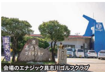
会場のエナジック具志川ゴルフクラブ

12月6日、エナジック具志川ゴルフクラブ(うるま市)で、昨年に引き続きエナジックインターナショナルが主催して、第2回目の「エナジック沖縄県小学生ゴルフ大会」が開催されました。