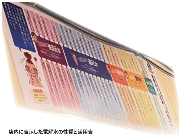
店内に表示した電解水の性質と活用表