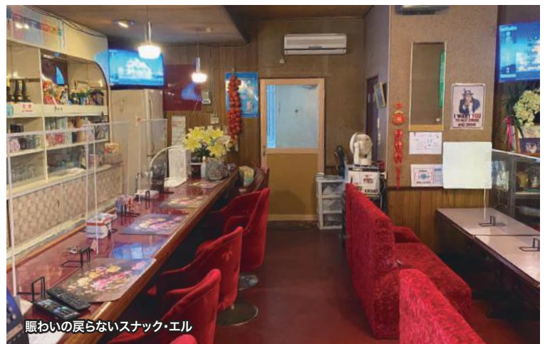
賑わいの戻らないスナック・エル