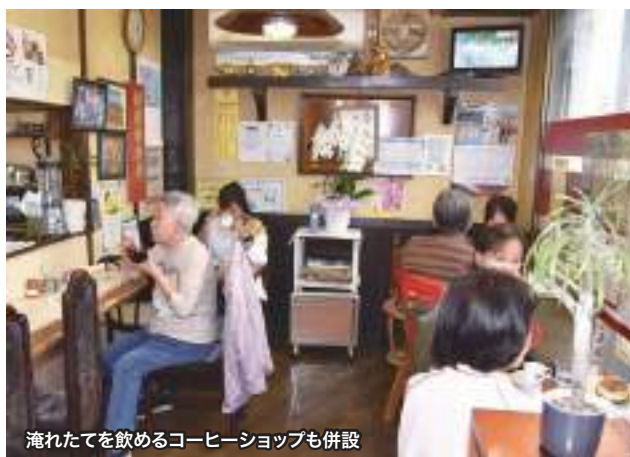
淹れたてを飲めるコーヒーショップも併設

If you know of any unique use for electrolyzed water, we'd love to hear from you! 電解水のユニークな活用法を募集中!