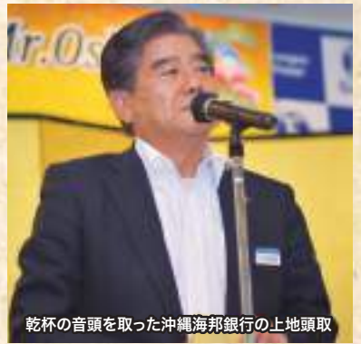
乾杯の音頭を取った沖縄海邦銀行の上地頭取