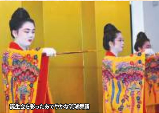
誕生会を彩ったあてやかな琉球舞踊