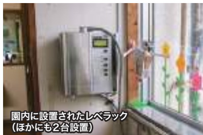
園内に設置されたレベラック (ほかにも2台設置)