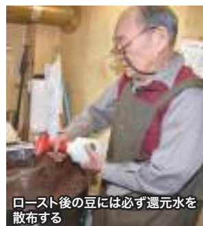
ロースト後の豆には必ず還元水を散布する

このほか、還元水はコーヒーショップで提供する料理等にも活用し、強酸性電解水は清掃・衛生管理に使用している。