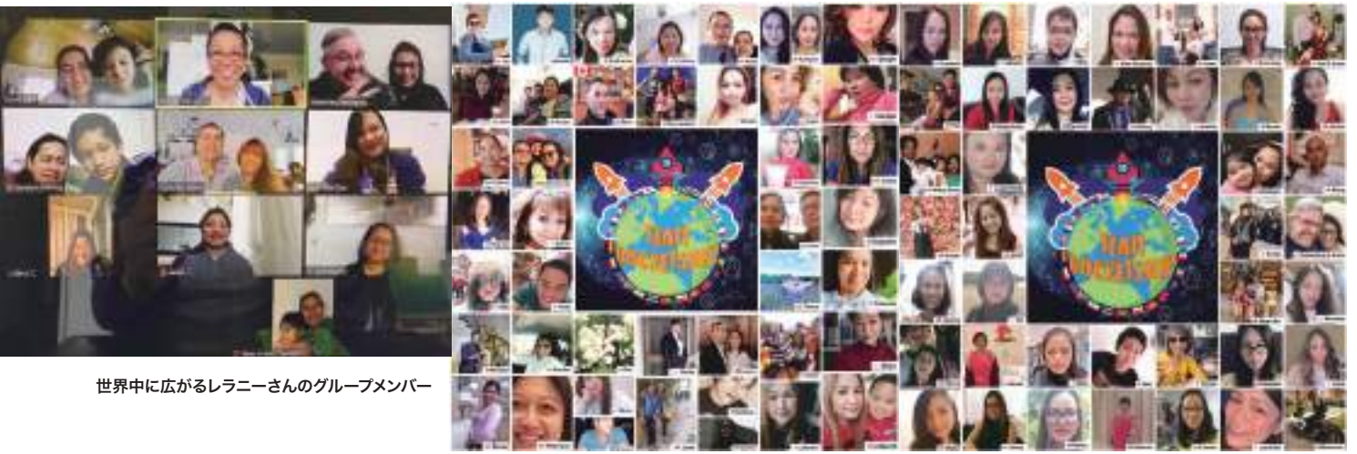
世界中に広がるレラニーさんのグループメンバー

たのだから、心身の負担は想像を絶するほど重かっただろう。当時を振り返り、「人生には予測不可能な厳しいことがたくさんあります」と、彼女は言うのだ。