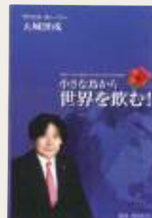
【前原利夫・著】 『小さな島から世界を飲む!』より】

フィリッツァー博士はご自分のクリニックでもレベラックを長年使用しているの、その効果についてはよく知っている。もし予想通りの結果が出れば、公的機関への医療器具認可申請の可能性が出てくるだろう、と博士は予測している。実験結果が楽しみだ。