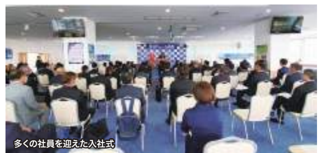
多くの社員を迎えた入社式