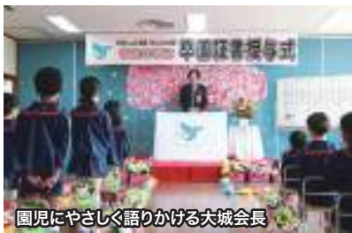
園児にやさしく語りかける大城会長

「これから皆さんは多くの“初めてのこと”を経験するでしょう。しかし最善を尽くせば、何ごとでも成し遂げることができます。わたしは皆さん一人ひとりを信じています。そして、皆さんはいつでもわたしのサポートを受けられるでしょう」