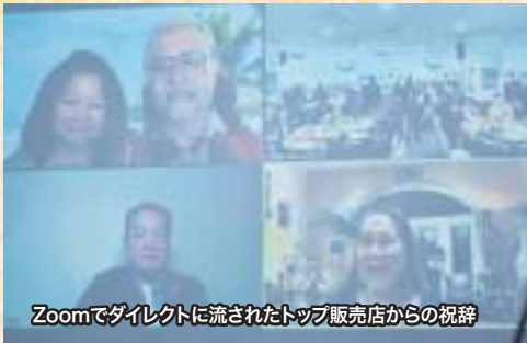
Zoomでダイレクトに流されたトップ販売店からの祝辞

その後、時差をものともせず、アメリカやインド、マレーシアのトップ販売店から大城会長に