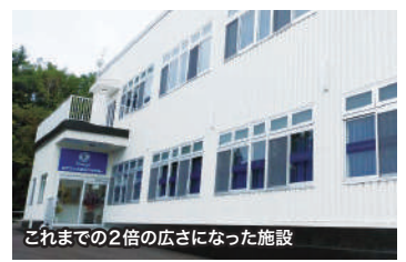
これまでの2倍の広さになった施設