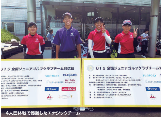
4人団体戦で優勝したエナジックチーム

8月10、11日に、三重県内のゴルフ場で第1回「U15全国ジュニアゴルフクラブチーム対抗戦」が開催され、全国各地からエナジックゴルフアカデミーチームを含む23チームが参加しました。