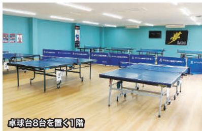
卓球台8台を置く1階

先ごろエナジック卓球アカデミーが、島尻郡南風原町にあるエナジック・スポーツワールドサザンヒルの隣接場所に移転しました。新築2階建てで、1階に卓球台を8台、2階に5台設置し、これまで以上にゆったりと練習できるようになりました。