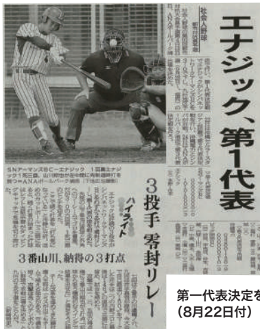
第一代表決定を伝える「沖縄タイムス」(8月22日付)

小学生から中学生までの男女4名が参加し、初日が4名×1チームの団体戦、2日目が2名×2チームの団体戦でおこなわれました。エナジックチームは4名の団体戦ではみごと優勝し、翌日の2名団体戦は9位タイに入りました。